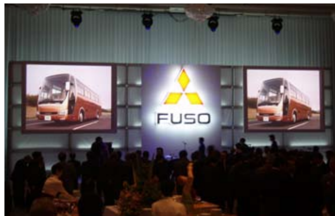
▲ 三菱ふそう発表会

16bitカラープロセッシングと1600:1のコントラストによる、高品位エッジレンディングが可能。