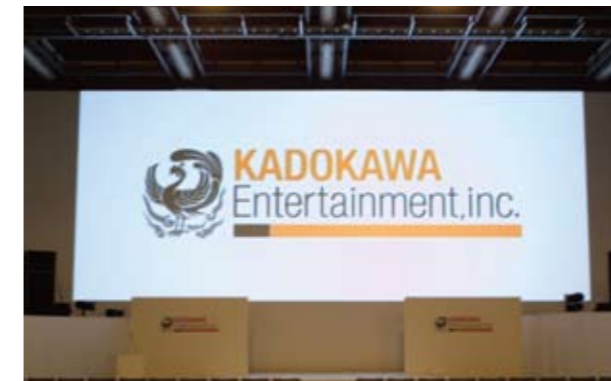
▲ 角川エンタテインメント ラインナップ発表会