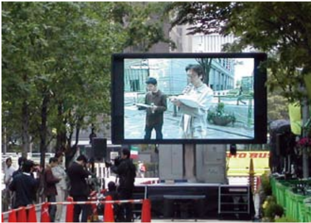
▲自転車スプリントGP in 丸の内

90度の回転機構に加え、リフトアップ機構を実現。多彩な環境に対応できる車載型LED映像システム。