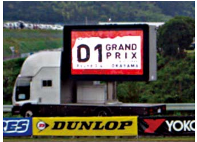
▲D1 GRAND PRIX

15mmピッチLEDを搭載し高輝度、高画質スプレを実現する「パノラマビジョンジュニア2号機」。190インチの画面に「90度回転機構」と「リフトアップ機構」を採用。パノラマビジョンジュニア1号機同様に、4t車をベースとして機動力を大幅に向上。プロモーション等のあまり条件の良くない設置環境においても頼りになる「2つの機能」が常に100%に近い能力を発揮。見る人に適格な情報と感動を与えることができる映像システムです。