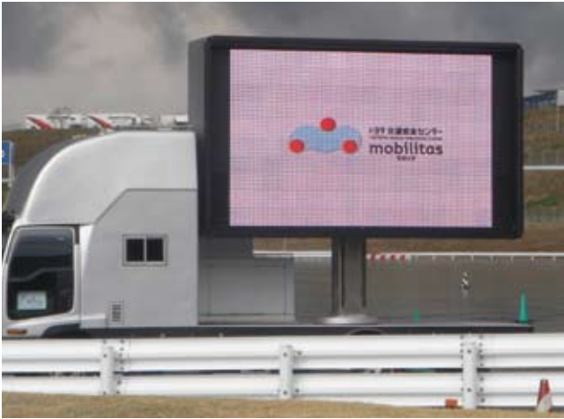
▲トヨタ モビリティ