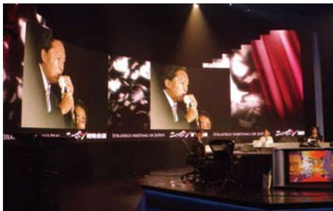
▲ 選挙スペシャル / ニッポン戦略会議 / テレビ東京