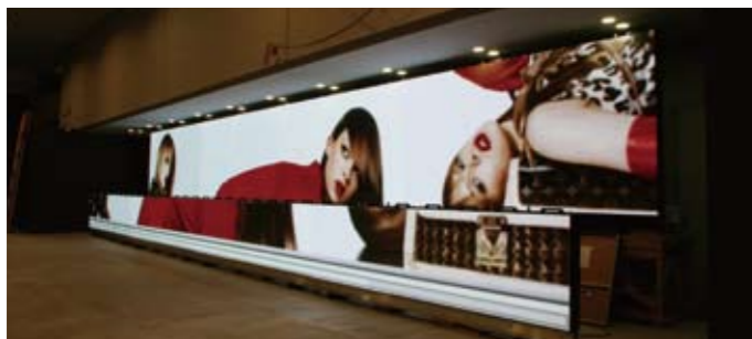
▲ ルイヴィトン パーティ