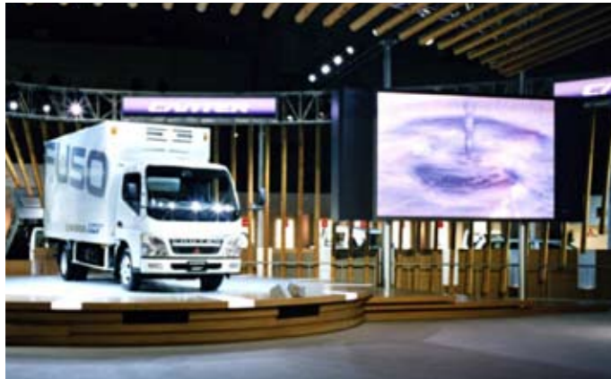
▲ モーターショー / 三菱ふそう