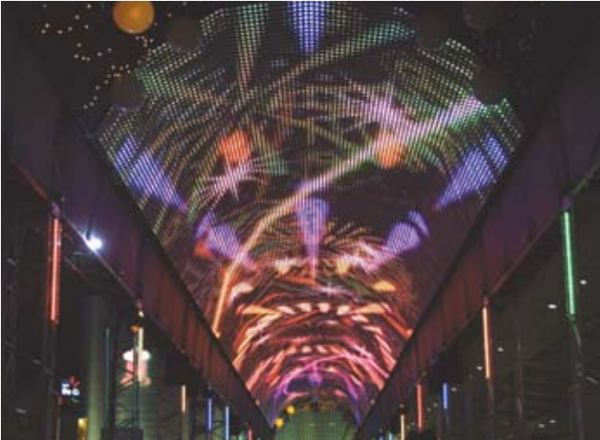
▲ JR 名古屋 プロムナード