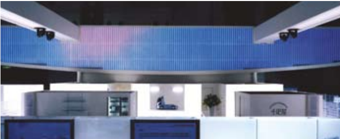
▲ 東京モーターショー 三菱ふそうブース

数千～万単位の巨大会場で伝えたいメッセージや映像がある。そんなシーンに最も適しているのがこの60mmピッチLEDです。ACTIV-60は、他のLEDとは異なるシースルータイプ、コンサート等で照明と組み合わせた演出も可能です。従来の平面的なスクリーンという概念にとられず、アーチ・ドームといった変則的な形状での使用も可能。新しいプレゼンテーションを実現するLEDです。