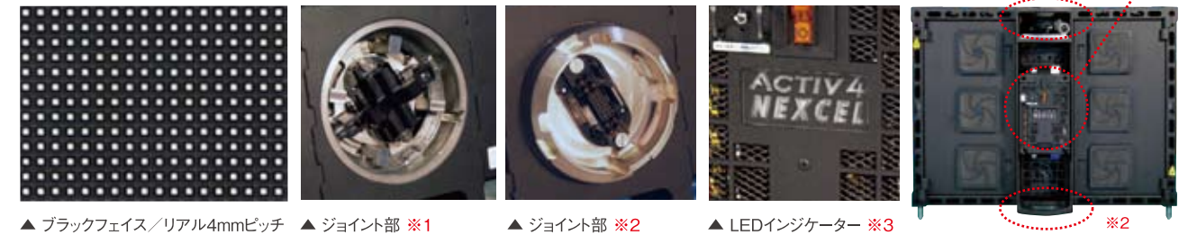
▲ ブラックフェイス/リアル4mmピッチ ▲ ジョイント部 *1 ▲ ジョイント部 *2 ▲ LEDインジケター *3