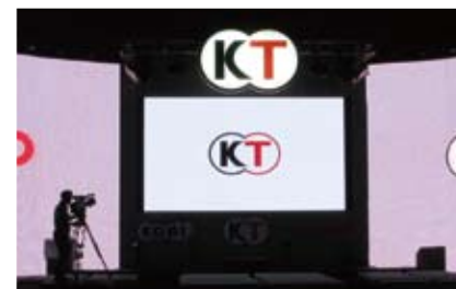
CEATEC JAPAN 2009 ▶ TOSHIBAブース